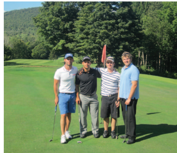
L'équipe représentant le bureau Heenan Blaikie Aubut

Un gros merci à tous les participants et aux commanditaires de l'événement !