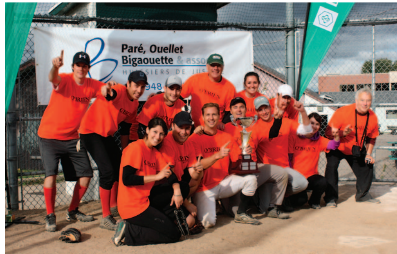
Nos gagnants, O'Brien Avocats en possession de la Coupe Paré, Ouellet, Bigaouette et Associés.

Le Jeune Barreau de Québec félicite Madame la Première Ministre Pauline Marois ainsi que le ministre de la Justice, M. Bernard St-Arnaud et tous les acteurs présents à l'Assemblée Nationale en matière de justice.