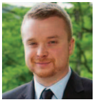
Par Me Louis Cloutier Frima Studio Inc

« Le droit mène à tout » est une expression clichée, mais qui résonne beaucoup pour moi. En effet, dans ce qui suit je vous ferai part de mon expérience en tant que seul avocat au sein d'une foule d'artistes, de programmeurs et de concepteurs de jeux; des gens aussi sympathiques qu'étranges. C'est dans ce climat unique que mon supérieur immédiat (un avocat défroqué) et moi avons bâti le département juridique de Frima Studio Inc., le plus grand studio indépendant de jeux vidéo au Canada.