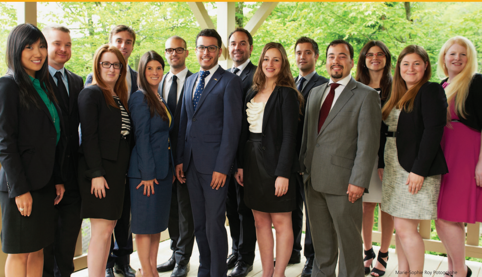
Marie-Sophie Roy Photographe