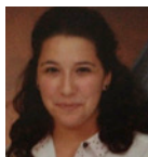
Par Mlle Myriam Sahi

Les comités d'éthique de la recherche sont présents dans tous les centres de recherche et établissements d'enseignement au Canada, ainsi que dans tous les centres privés effectuant des recherches dans le domaine biomédical. L'encadrement de ces comités d'éthique est régi par l'Énoncé de politique des trois conseils (EPTC), un cadre normatif élaboré par le gouvernement fédéral depuis 1998 et dont la dernière mise à jour fut diffusée le 18 décembre dernier. Depuis la mise en place de l'EPTC, un membre versé en droit doit obligatoirement siéger sur les comités d'éthique de la recherche lorsque de la recherche biomédicale est effectuée dans un établissement. La présence de ce membre crée une interface unique entre le droit des personnes et de la propriété intellectuelle et l'application concrète de ce droit par les intervenants du milieu.